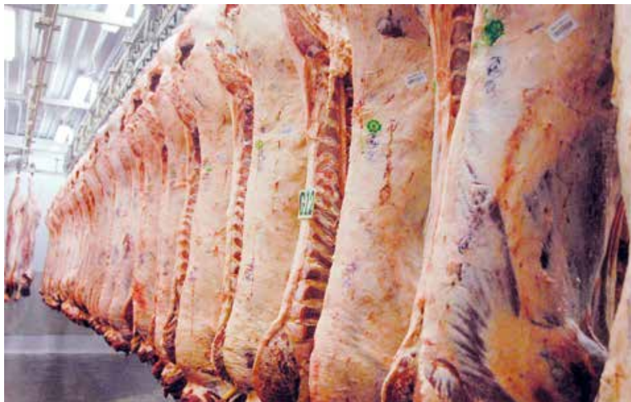
Suid-Afrika voer tans 15 000 tot en 20 000 ton beevleis na China en ander Asiatiese lande uit, meestal as bevrore beevleis. Heelwat meer uitvoergeleentede wag om ontgin te word.

My eie mening het begin verander toe ek vir die Britse Meat and Livestock Commission (MLC) en later vir Meat and Livestock Australia (MLA) as deel van 'n beurs vir my